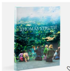
THOMAS STRUTH 45,00 €