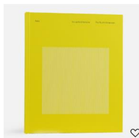
SOTO. LAUGARREN DIMENTSIONA 39,00 €