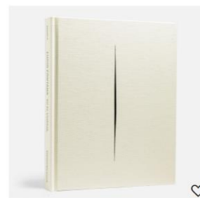
LUCIO FONTANA. ATALASEAN 39,00 €