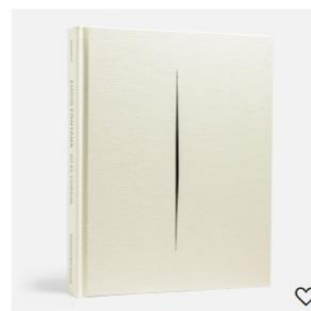
LUCIO FONTANA. ATALASEAN 39,00 €