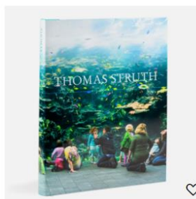
THOMAS STRUTH 45,00 €