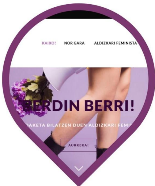
Berdinberri! Eduki digital feministak, euskaratik eta euskaraz