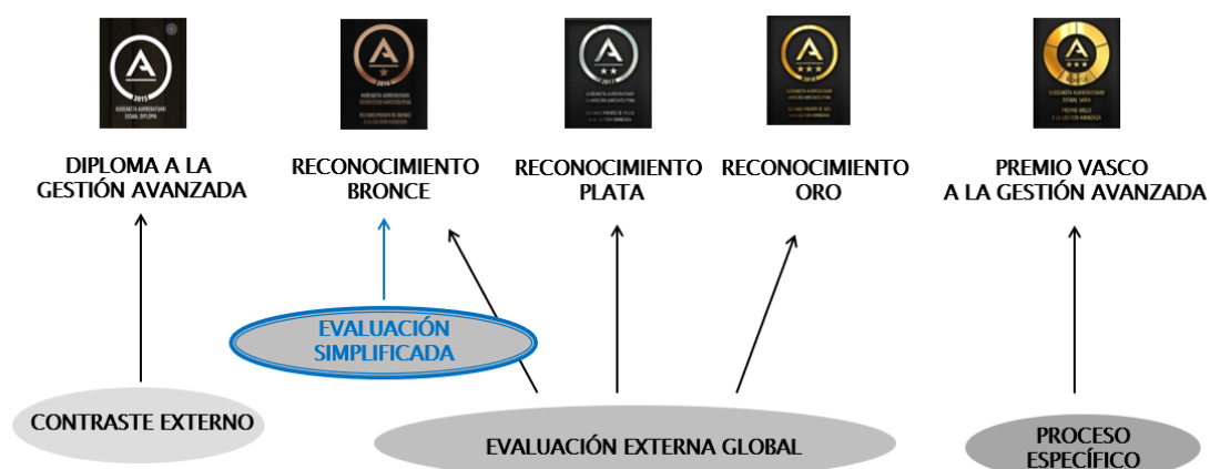
Esquema de acompañamiento y reconocimientos a la gestión avanzada

Una vez que la organización haya recibido el Diploma a la Gestión Avanzada, podrá aprovechar al máximo todos los beneficios del servicio de evaluación externa de EUSKALIT, y acceder además a los reconocimientos A de Bronce, A de Plata y A de Oro a la Gestión Avanzada que otorga el Gobierno Vasco: